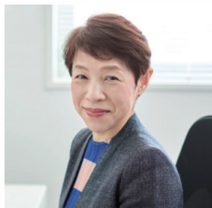
新潟食料農業大学 教授 ジャーナリスト 青山 浩子